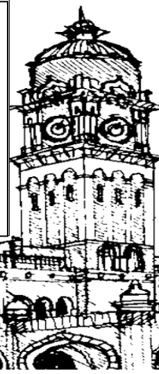
Bangunan Sultan Abdul Samad, Kuala Lumpur

SHAH ALAM : Bangunan bersejarah merupakan bangunan yang wajar dipelihara. Sultan Selangor Sultan Sharafuddin Idris Shah telah bertitah agar pihak berkuasa melaksanakan pemuliharaan dan pemeliharaan bangunan bersejarah di Malaysia. Menurut baginda, kebanyakan bangunan bersejarah berpotensi untuk menjadi tumpuan pelancong dari dalam dan luar negara.